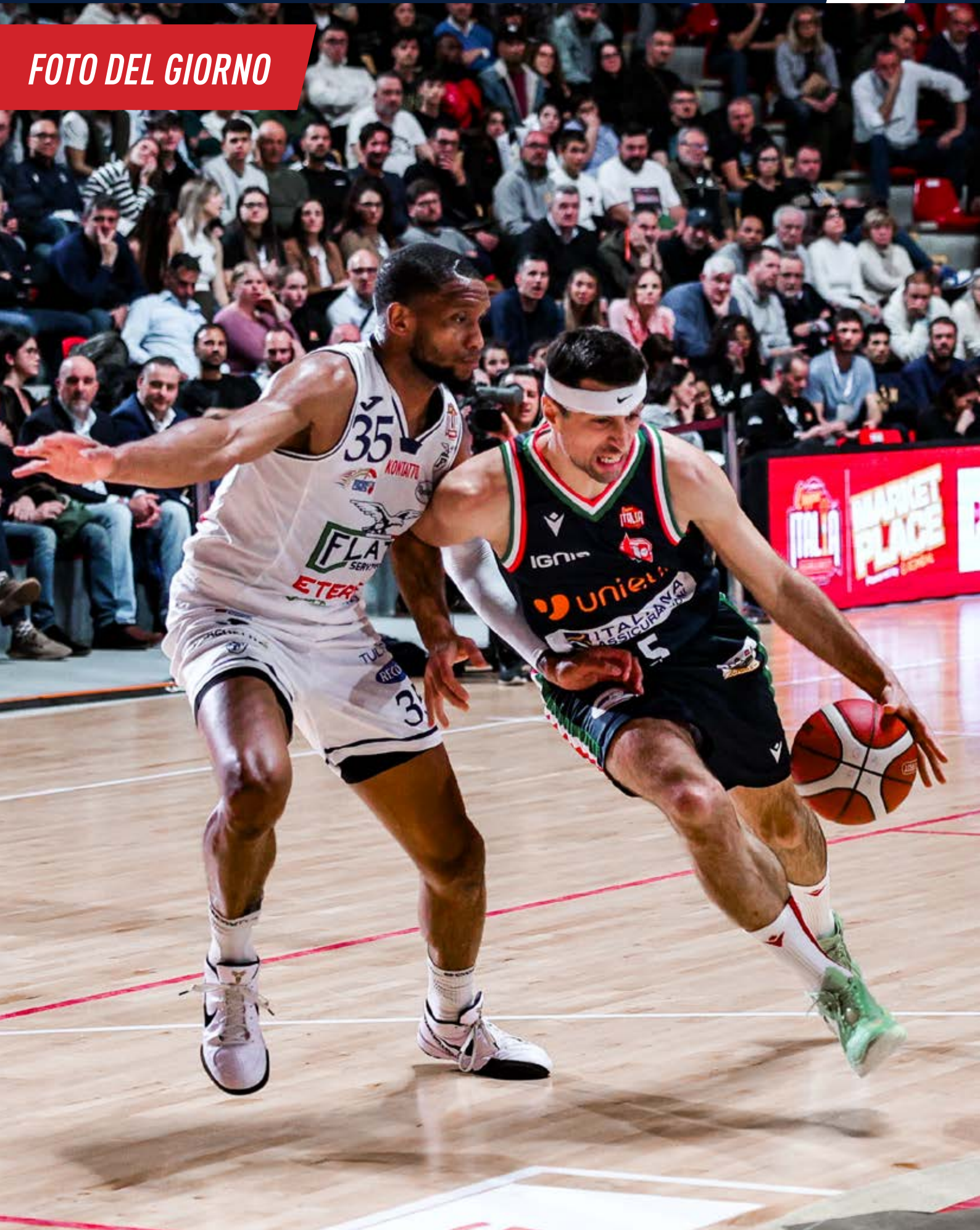
FOTO DEL GIORNO