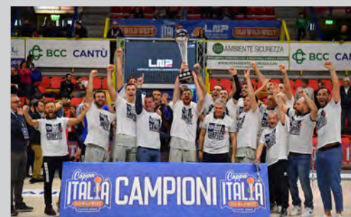
2023 - AGRIBERTOCCHI ORZINUOVI