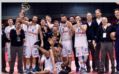
2015 - TEZENIS VERONA