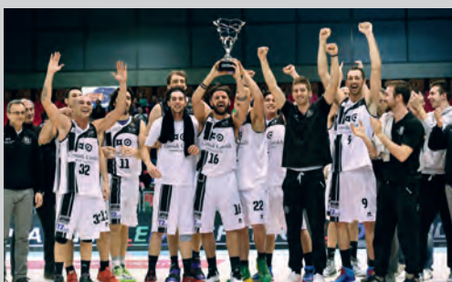
2015 - CONTADI CASTALDI MONTICHIARI