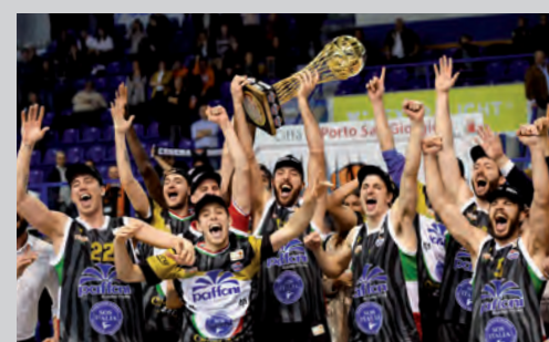
2019 - PAFFONI OMEGNA