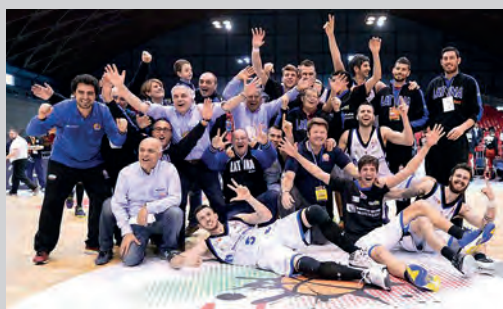
2014 - BENACQUISTA LATINA