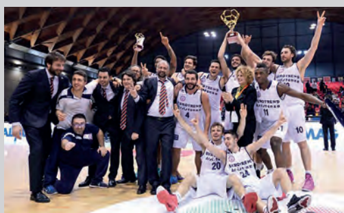
2014 - EUROTREND BIELLA