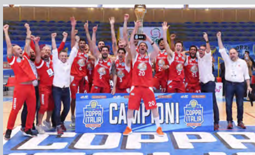
2021 - BAKERY PIACENZA