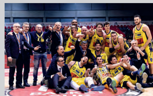
2016 - GIVOVA SCAFATI