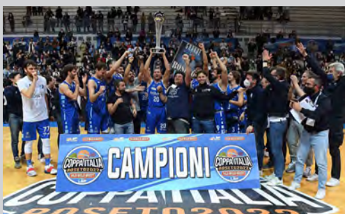
2022 - LIOFILCHEM ROSETO