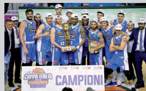
2019 - DE' LONGHI TREVISO