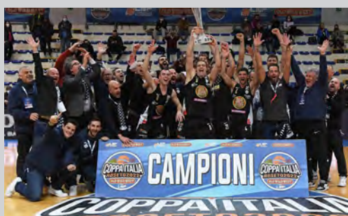
2022 - OLD WILD WEST UDINE