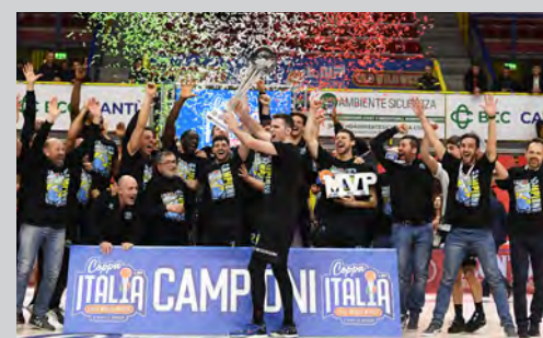
2023 - VANOLI CREMONA