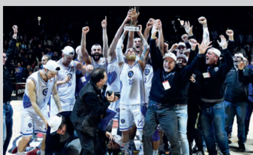
2017 - CUORE NAPOLI BASKET