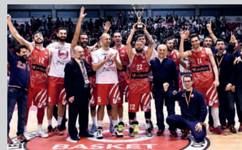
2016 - UNIEURO FORLÌ