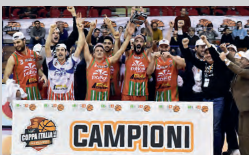
2018 - PAFFONI OMEGNA