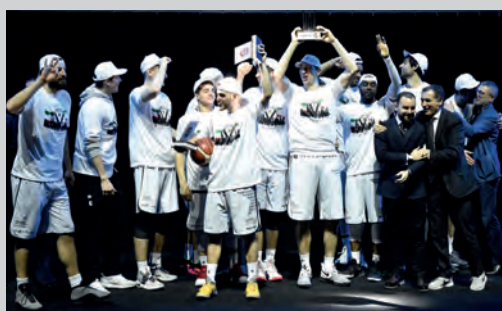
2017 - VIRTUS SEGAFREDO BOLOGNA