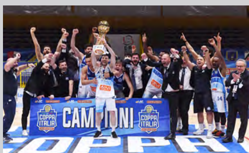
2021 - GEVI NAPOLI